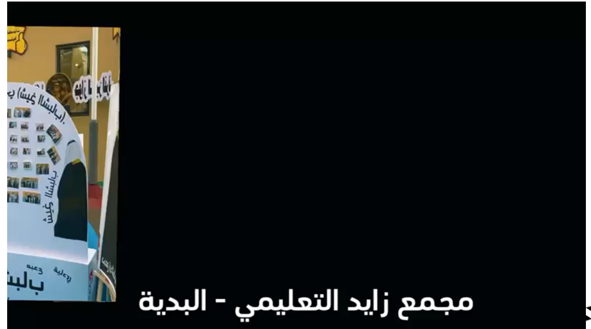
مجمع زايد التعليمي - البدية